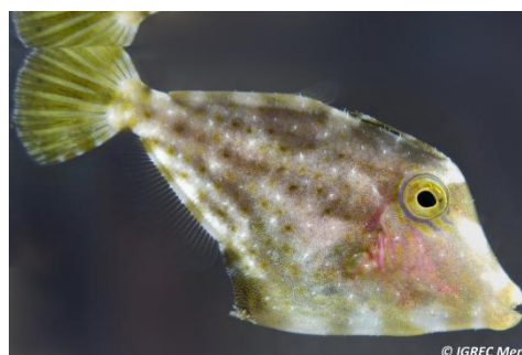
Figure 1 : Cantherines sp