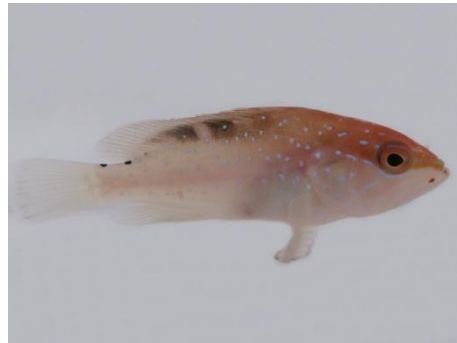
Figure 1 : PL d' Epinephelus fulvus - J0 (4 cm)