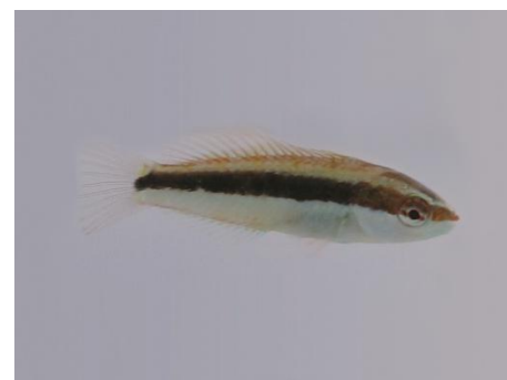
Figure 5 : PL de labridae - J0 (1,5 cm)