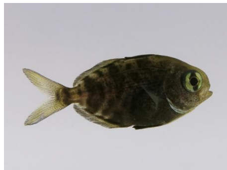
Figure 3 : PL inconnue - J0 (4 à 6 cm)